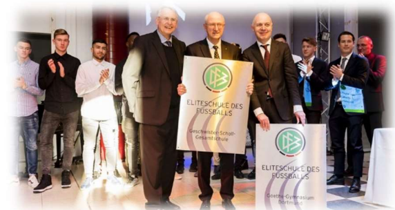
Festakt Eliteschule des Fußballs – GSG – Aula

Seit 8 Jahren ist es das Ziel unserer Kooperation, die notwendigen strukturellen Voraussetzungen zu schaffen und immer wieder zu optimieren, um eine bestmögliche Verknüpfung von Leistungssport und schulischer Ausbildung umzusetzen.